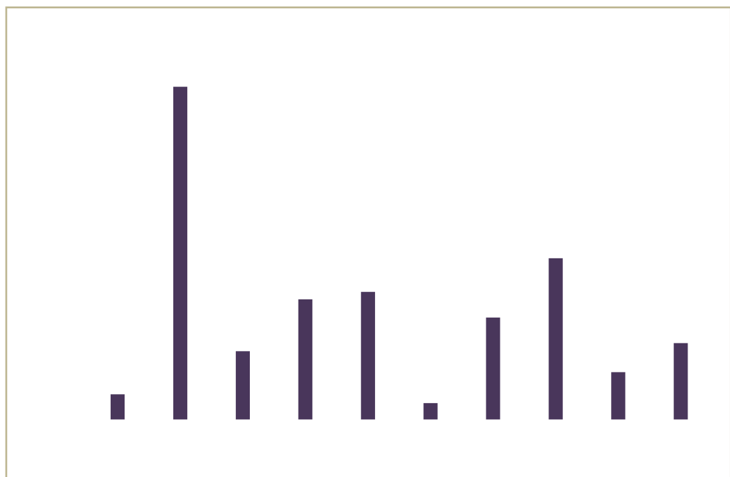
Figure 3. Nombre de chirurgies de trachome (janvier-décembre) et cible annuelle, 2016, Région de l'Amhara, Ethiopie

2015, (c) 1 2016, ( ) 2014, 2 18 10 2016, 106, 152 82 000 2016, 81% 102 476 3 2016 2016. E