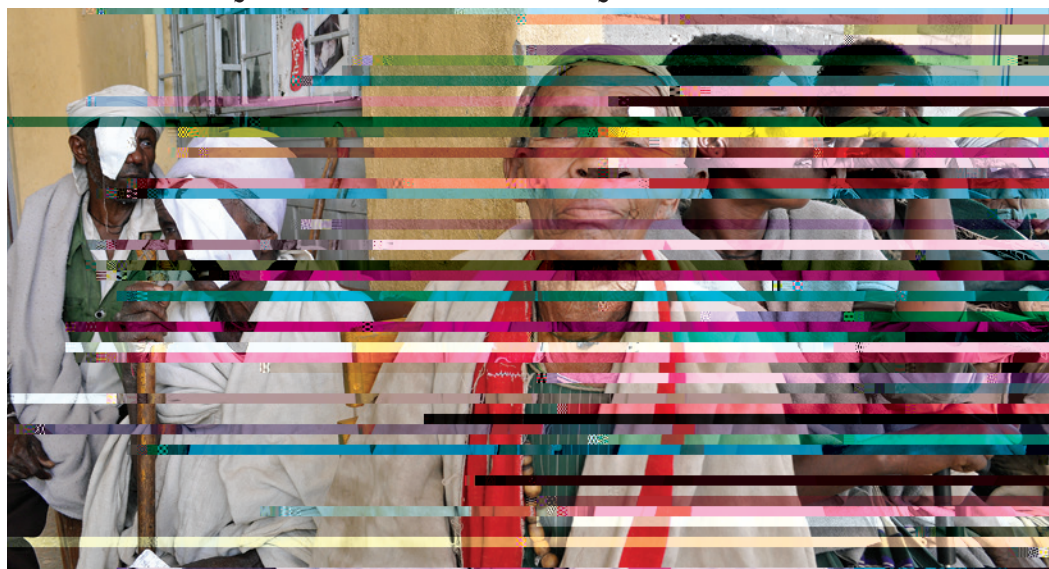
Dans l'Amhara orientale, Ethiopie, les patients du trachome attendent la chirurgie de la paupière (devant et à droite) ou se remettent de la chirurgie (à gauche)